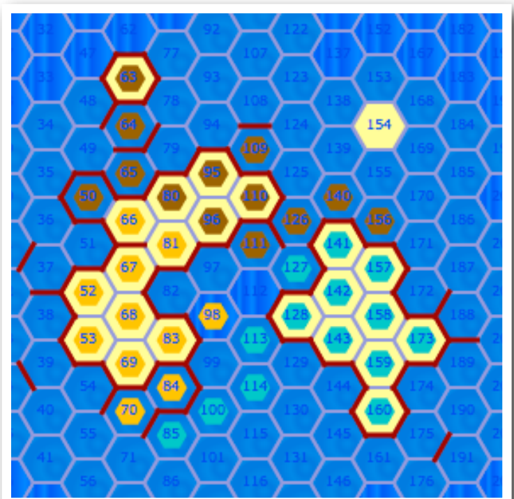
Het spel is afgelopen. Blauw heeft met 9 punten gewonnen. Oranje heeft 8 punten en bruin 5.